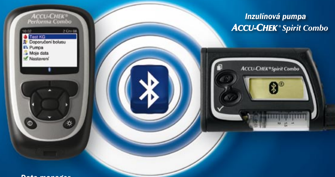
Data manager ACCU-CHEK® Performa Combo

Accu-Chek® Combo je inzulínová pumpa určená všem aktivním pacientům, kteří chtějí kontrolovat svůj diabetes diskrétně, snadno a rychle!