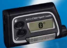
Systém Accu-Chek® Combo (inzulínová pumpa + data manager)

Každý pacient získává společně se systémem Accu-Chek® Combo také záložní glukometr, sadu testovacích proužků a lancet, aby si mohl vyzkoušet jednoduché a pohodlné měření glykémie.