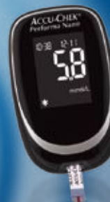
Záložní glukometr Accu-Chek® Performa Nano