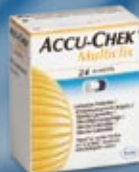
24 ks lancet Accu-Chek® Multiclix