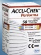
50 ks testovacích proužků Accu-Chek® Performa